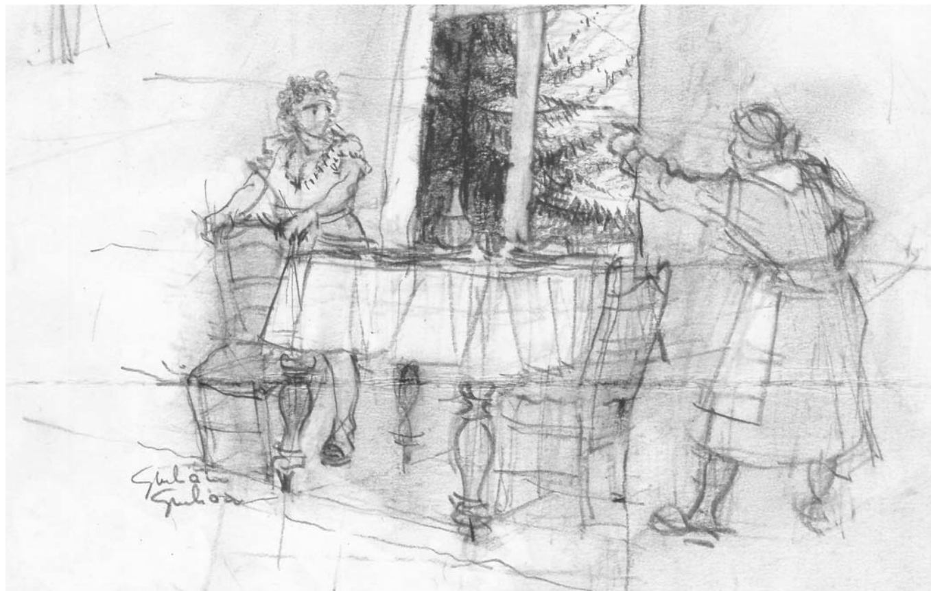
Illustrazione di Giuliano Giuliani